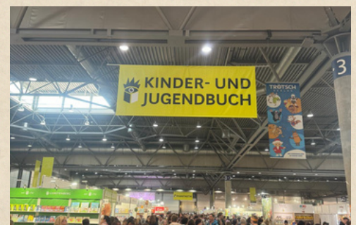
Abb. 2 Blick in Halle 3

„Die Welt ist ein Buch. Wer nie reist, sieht nur eine Seite davon.“ – Augustinus von Hippo